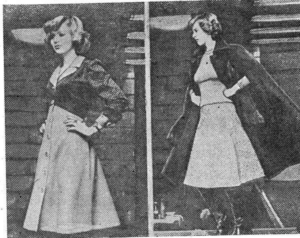
Нарядное платье из джерси. Сочетание цветов: голубой, красный, белый. Темно-коричневое платье с подобранными в тон сапогами, светло-серый полувер и яркая юбка. Фото МТИ — ТАСС.