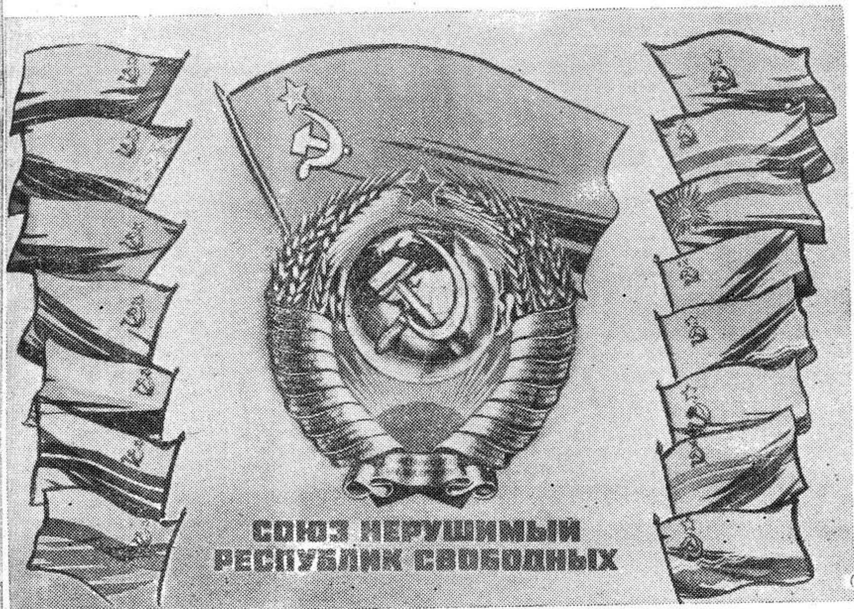
Плакат издательства «Изобразительное искусство»