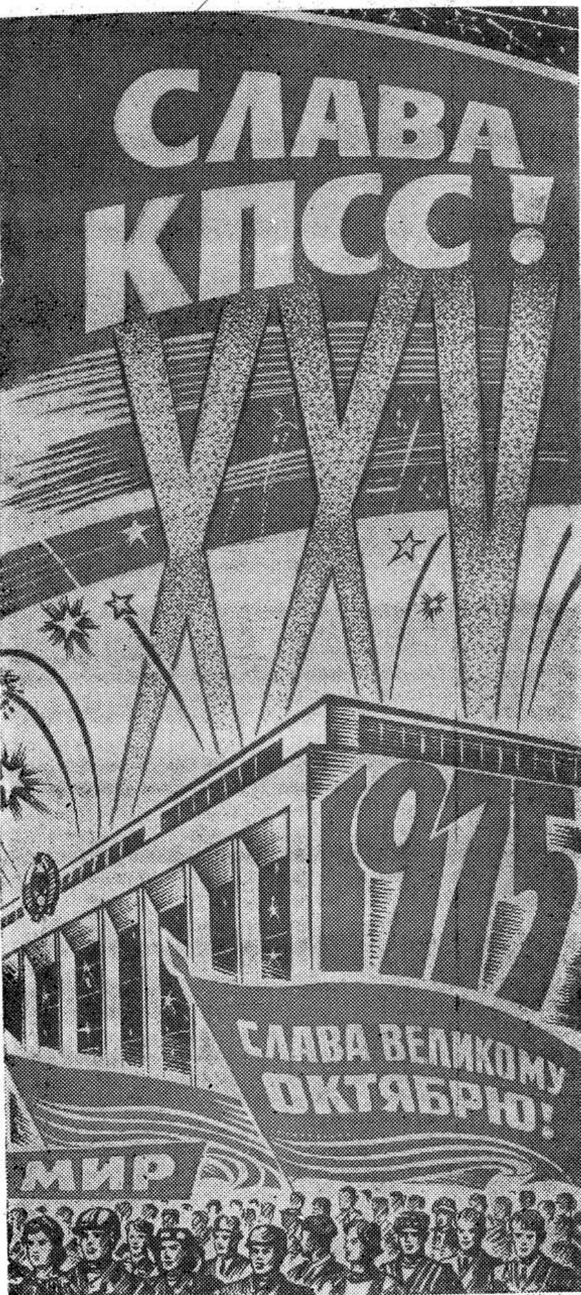
Плакат издательства «Московская правда».

Плодотворное влияние Великой Октябрьской социалистической революции испытывает на себе весь мир. Она открыла новую эру в истории человечества, дала могучий толчок всему общественному развитию. Строительство коммунизма в СССР слу-