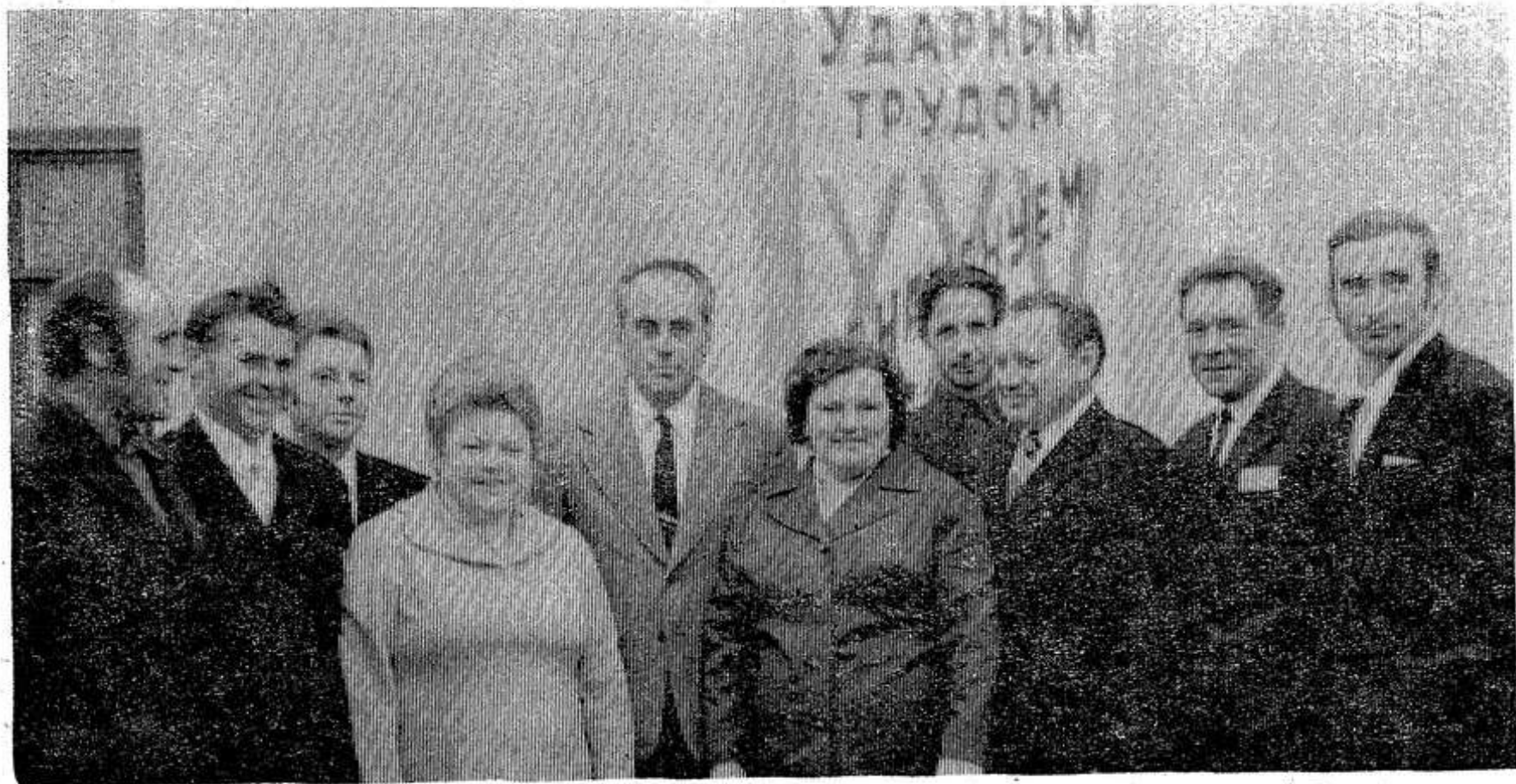
НА СНИМКЕ: делегация совхоза «Красный фронтвик» на XXI районной партийной конференции.

Докладчик далее говорит о проделанной работе коллективами школ и учебных заведений, культурно-просветительских, спортивных коллективами, редакциями газеты «Красный маяк» и местного радиовещания, подчеркнул, что все формы идеологической работы должны быть направлены на воспитание трудящихся района в духе коммунистической убежденности, верности ленинским заветам, делу нашей партии, по мобилизации людей на успешное решение задач коммунистического строительства.