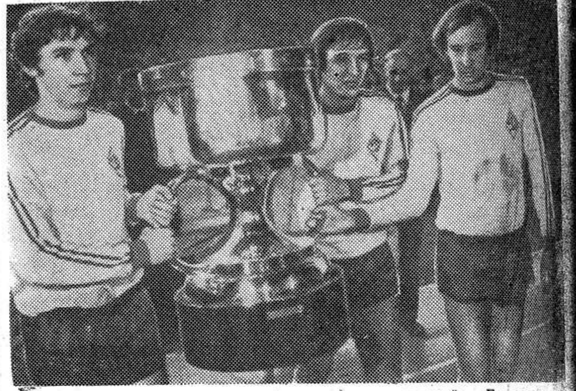
Выиграли в Киеве ответный матч у мюнхенской «Баварии» со счетом 2:0, киевские динамовцы завоевали европейский Суперкубок по футболу...

И в семье от него проку мало. Все домашние дела и заботы на плечи жены ложатся. А она и в колхозе дояркой работает.