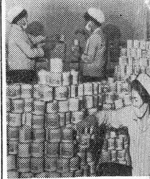
Демократическая Республика Вьетнам. Плато Моктяу в провинции Шонла превращается в район развитого животноводства. Здесь создано крупное специализированное государственное хозяйство. Построен молочный завод. НА СНИМКЕ: банки со сгущенным молоком на складе готовой продукции завода.