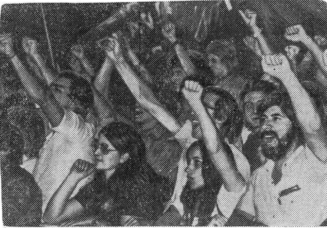
По всей Италии проходят митинги и демонстрации, участники которых выражают солидарность с борьбой испанских демократов, протестуют против террора и насилия, царящих в Испании. НА СНИМКЕ: участники демонстрации в Риме.

Опочечкому ремзаводу ТРЕБУЮТСЯ рабочие-строители. Нуждающиеся обеспечиваются жилищно-площадью в течение 1-1,5 лет.