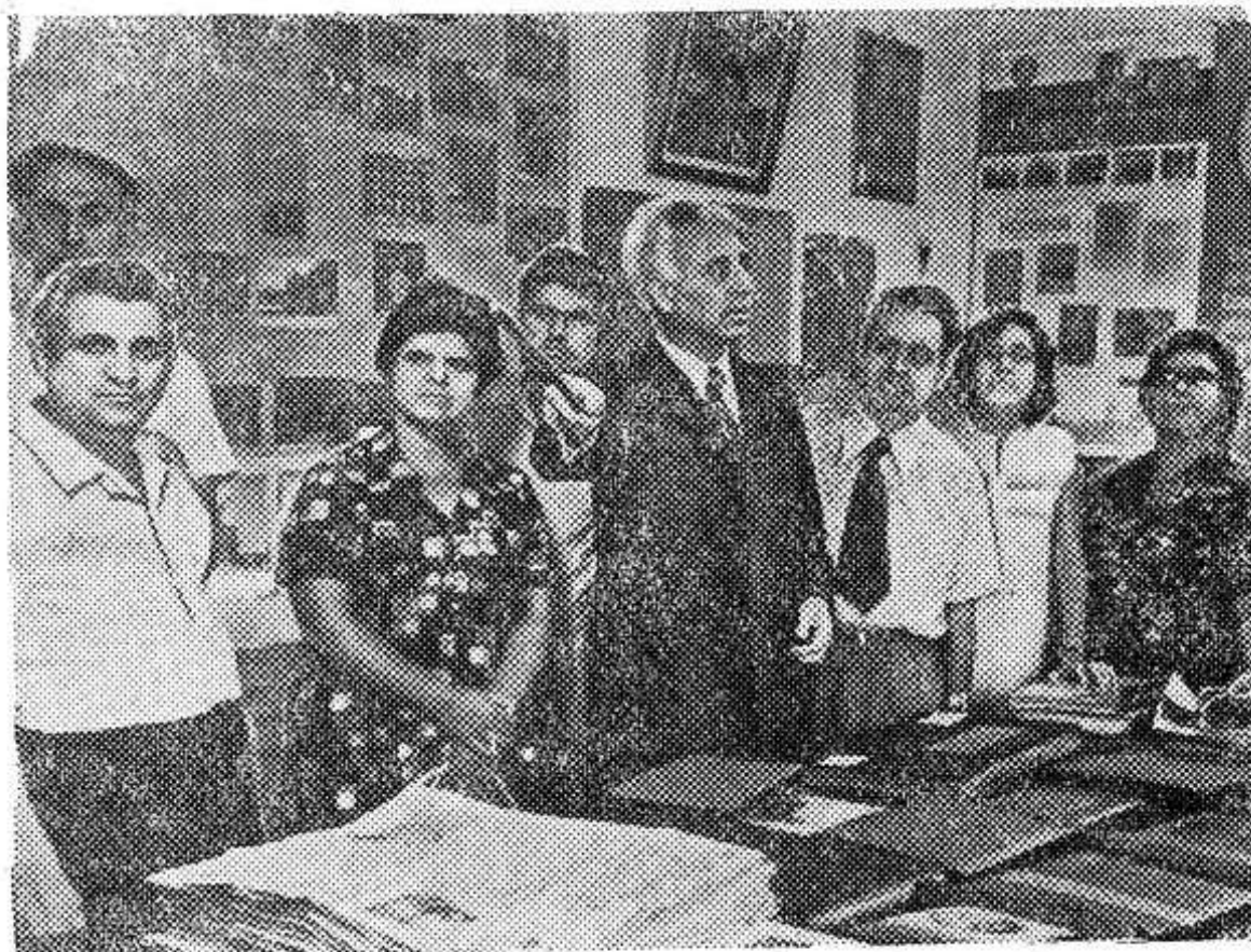
Группа болгарских учителей из города Станке-Димитрова в Брянске. Учителя НРБ знакомятся с постановкой учебного процесса в школах и профтехучилищах города.

НА СНИМКЕ: в музее советско-болгарской дружбы Брянского городского профтехучилища № 19.