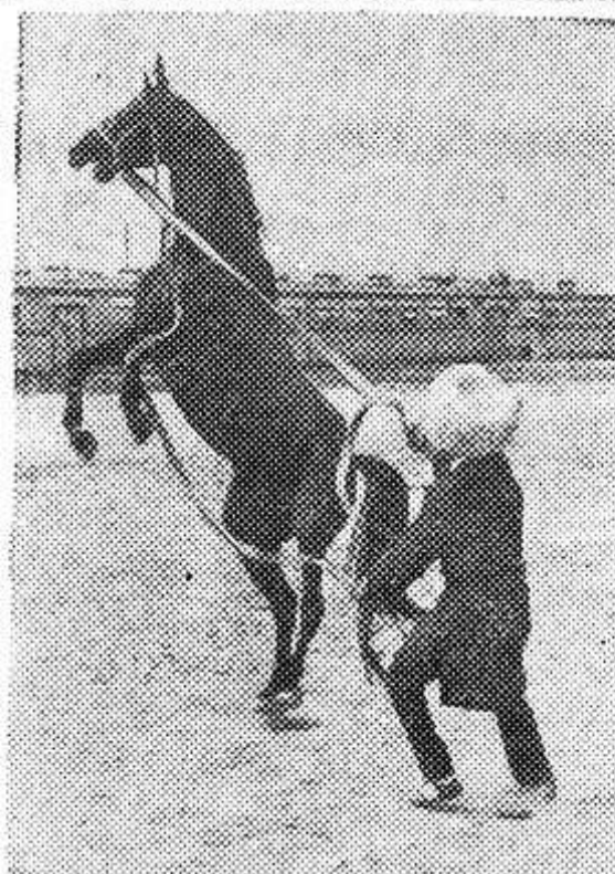
Туркменская ССР. Ахалтекинские кони — красивые, выносливые и быстрые — славились еще в древности. Ныне, благодаря международным аукционам, они известны и в Европе, и на американском континенте — в США, Мексике. Ахалтекинцев разводил конный завод, расположенный в местечке Балыр под Ашхабадом. На конюшне 500 чистокровных коней. Завод неоднократно награждался золотыми медалями ВДНХ СССР. Жюкен завода выходили победителями в различных состязаниях.