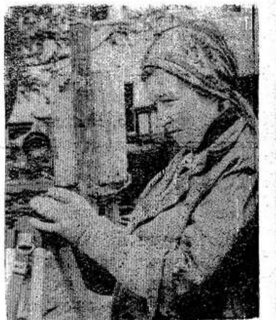
корд строительства. К 58-й годовщине Великого Октября рабочие ремзавода получают ключи от новых квартир.

И вот мастер снова торопится на улицу. Нужно еще раз проверить правильность сооружения сарая, что расположится рядом с домом. Это уже заключительный ак-