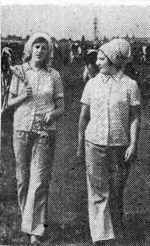
Ленинградская область. Подведены итоги VII Всесоюзного конкурса мастеров машинного доения, проводившегося в головном совхозе производственного объединения «Детское сельское».