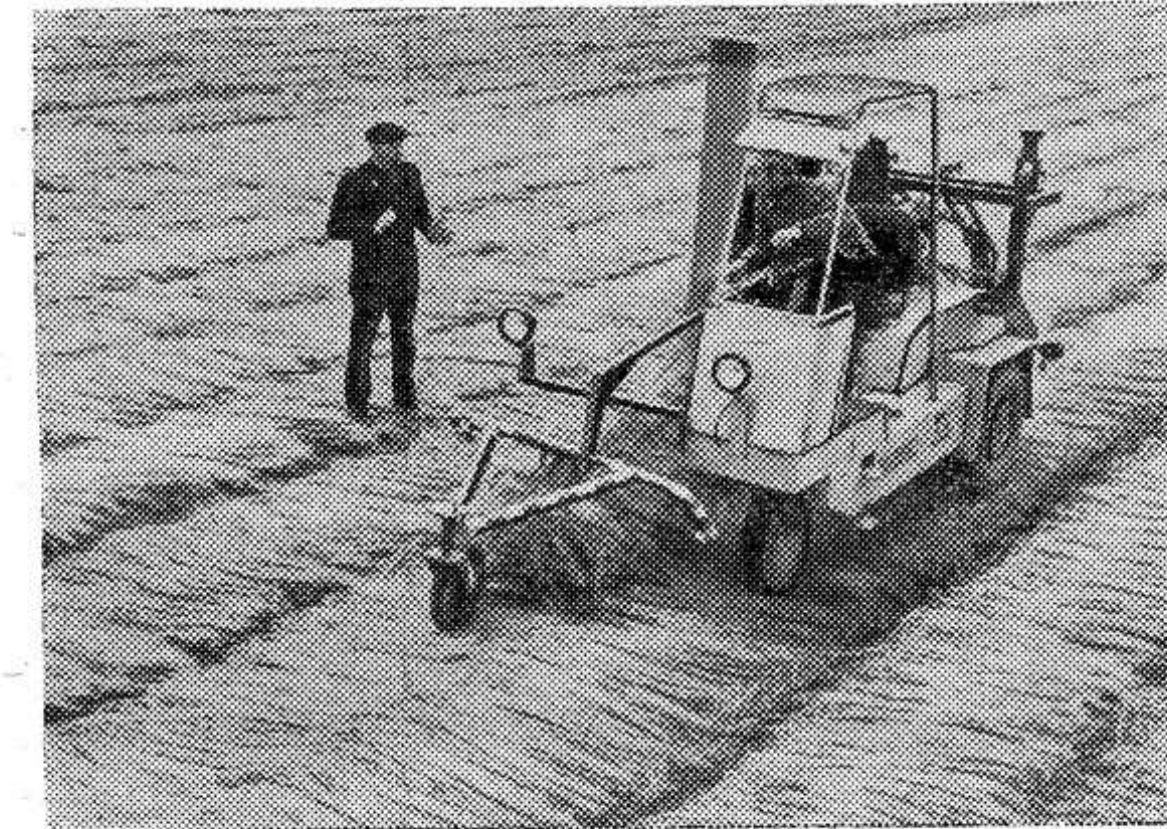
Калининская область. Богатый парк льноуборочных машин колхоза «Дружба» Бежецкого района пополнился новым высокопроизводительным подборщиком-оборачивателем с вязальным аппаратом