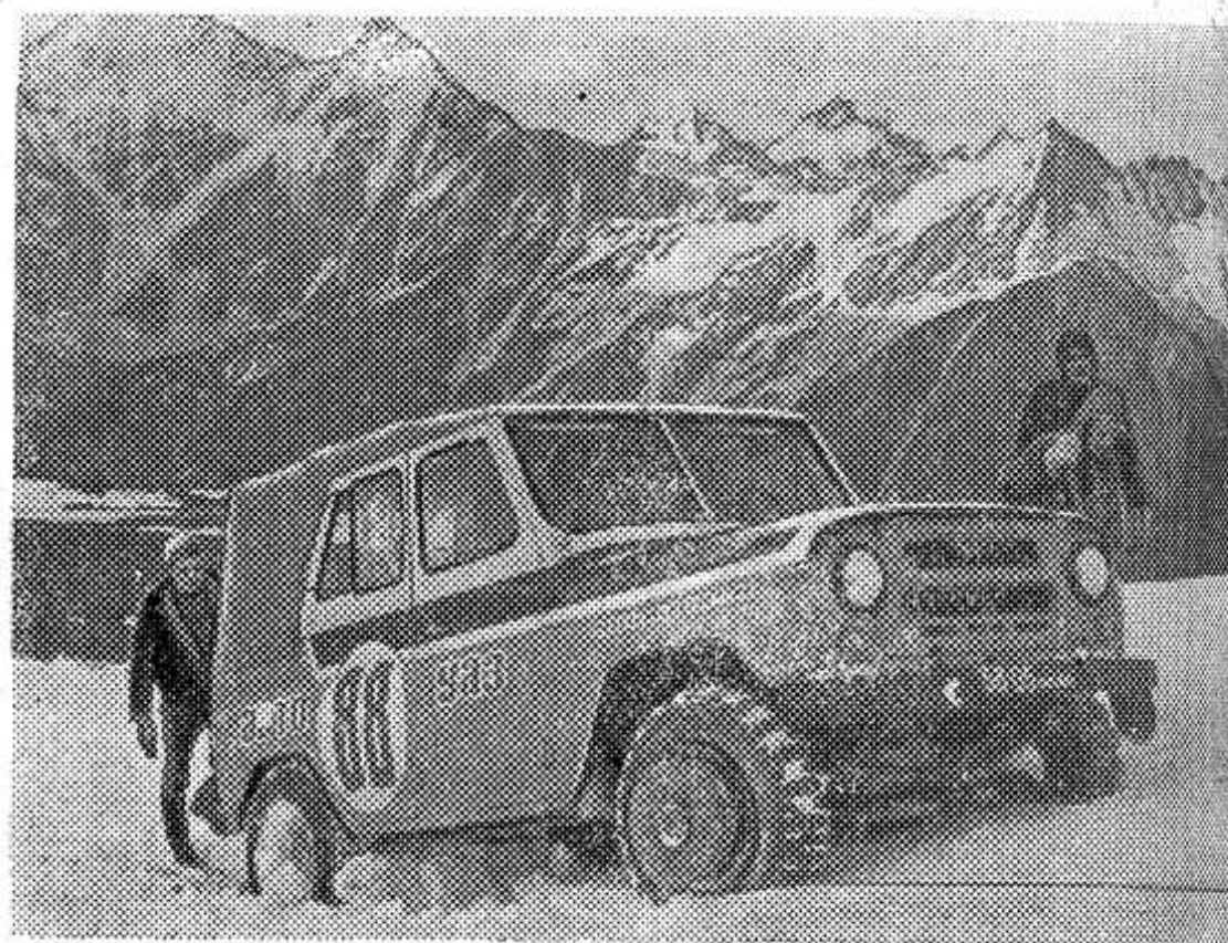
Терскол (Кабардино-Балкарская АССР). Спортсмены Ульяновского автозавода имени В. И. Ленина провели второй этап штурма высокогорных районов Приэльбрусья на автомашинах УАЗ.

В прошлом году автозаводцы за короткое время поднялись к Ледовой базе и вышли к леднику Терскол. Этому спортивному достижению способствовала отличная погода. Ныче дорогу машинам преграждали снежные заносы, камнепады, скрытые под снегом трещины. И, наконец, по-