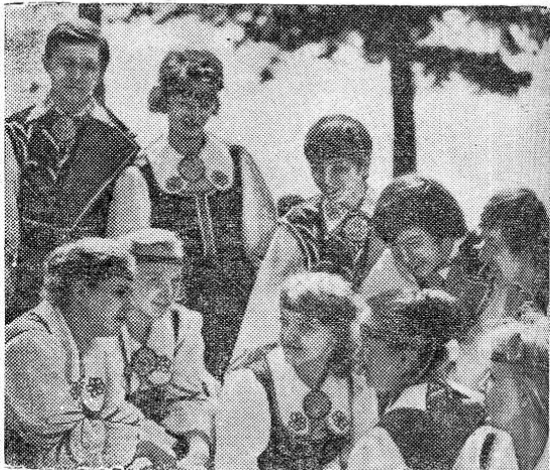
Молодежный карельский ансамбль «Руна» (на снимке) объединяет 300 учащихся общеобразовательных школ и системы профтехобразования республики. С искрометным искусством его исполнители знакомы жители Москвы и Ленинграда, республик Советской Прибалтики.

Ансамбль участвует во Всесоюзном фестивале самодельного художественного творчества трудящихся.