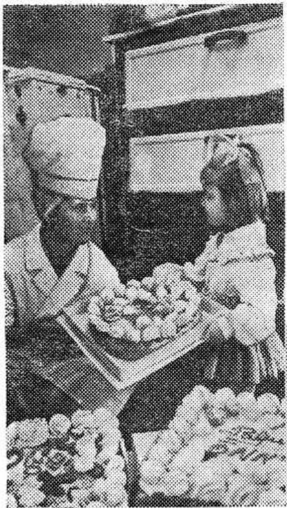
Меняется облик эстонской деревни. На смену хуторам встают благоустроенные поселки. Газ, горячая вода, телефон становятся обязательными атрибутами жилищ сельских труженников.

Мы вступили во второе полугодие. Рабселькоры призваны горячим словом помочь трудящимся в выполнении намеченных планов, принятых обязательств. Редакция ждет материалы, рассказывающие о героике труда, достижениях и успехах передовиков, о культурном досуге людей. Ждем также материалы о работе предприятий торговли и общественного питания, об организации летнего отдыха детей, о работе клубов, библиотек и на другие темы, отражающие жизнь и труд опочан.