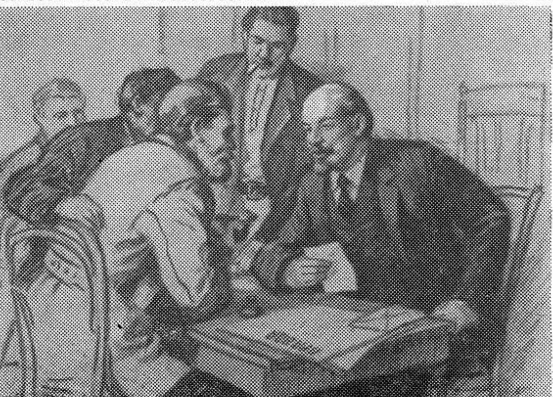
В. И. Ленин беседует с рабочими корреспондентами в редакции газеты «Правда» (1917 г.)

«ГАЗЕТА — НЕ ТОЛЬКО КОЛЛЕКТИВНЫЙ ПРОПАГАНДИСТ И КОЛЛЕКТИВНЫЙ АГИТАТОР, НО ТАКЖЕ И КОЛЛЕКТИВНЫЙ ОРГАНИЗАТОР». (В. И. ЛЕНИН).