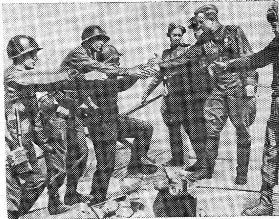
Эпизод встречи на Эльбе (город Таргау) советских и американских войск (апрель 1945 год).