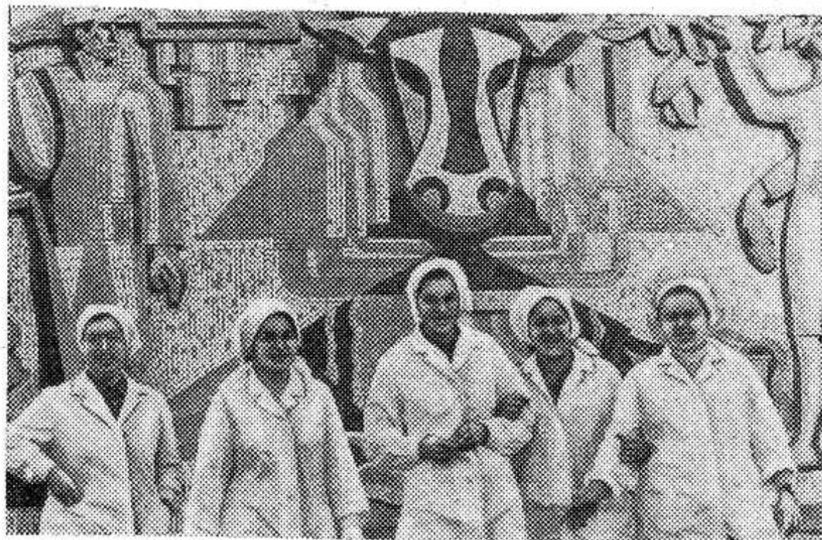
НА СНИМКЕ СЛЕВА: животноводческий комплекс «Варатик».

водственного объединения «Молокопром» будет производить в год десять тысяч тонн молока. Операторы машинного доения работают посменно, каждый обслуживает по сто коров.