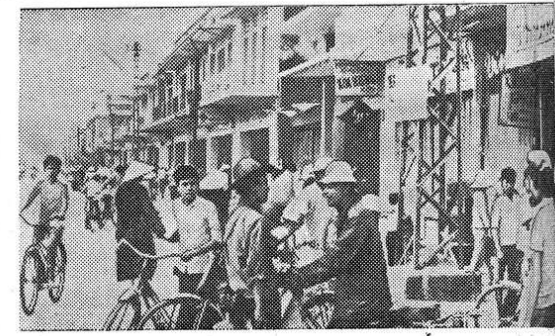
Южный Вьетнам. Народные вооруженные силы освобожденные (НВС) в тесном взаимодействии с местными партизанами и в результате освободили более 15 провинциальных центров Южного Вьетнама, в том числе три самых крупных после Сайгона городов страны. Около 80 процентов территории находится в зоне контроля ВРП РЮВ.

команд — юношей и девушек. Наши юноши заняли шестое место. Девушки вышли в финал, который состоится 26-27 апреля в г. Великие Луки. Л. Никитенко.