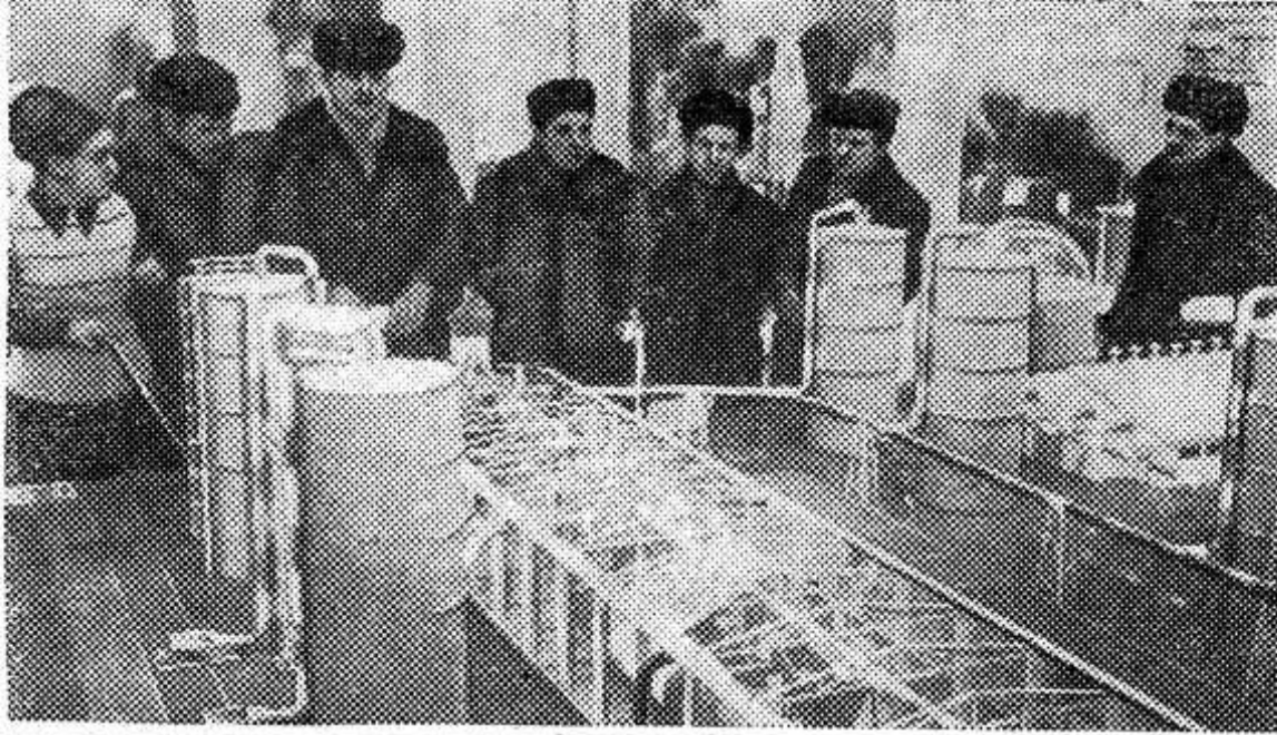
Москва. Всесоюзный научно-исследовательский институт кормов имени В. Р. Вильямса разработал и построил в опытно-производственном хозяйстве Ермолино завод для производства брикетов и гранул на основе искусственно высушенных трав. Производительность завода — 3—4 тонны в час. Себестоимость одной тонны брикетов и гранул — 70—80 рублей. НА СНИМКЕ: макет завода в павильоне «Корма» ВДНХ.

негодность, мало беспокоит руководителей, специалистов хозяйства. За последние годы качество выполненных мелиоративных работ несколько улучшилось. И все же случается, когда Опочецкая ПМК сдает объекты в эксплуатацию с недоделками. Чаще всего это относится к таким работам, как крепление каналов, очистка площадей от мелкого камня, первичная обработка земель, планировка их. Кроме того, с великим трудом устраняются паводковые разрушения. В 1974 году недостатки, отмеченные комиссией в колхозе «Вперед», были устранены лишь глубокой осенью. Когда же, наконец, будет отремонтирован ручей в колхозе имени Мичурина, разрушенный паводком в 1973 году? До сего времени ремонтные работы не ведутся. Р. Браварник, инженер по технадзору за мелиоративным строительством райсельхозуправления.