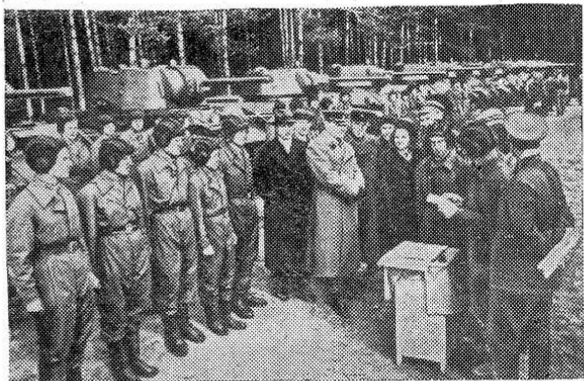
Представитель танковой части Красной Армии зачитывает экипажу акт о передаче танков. Действующая армия, 1942 год.