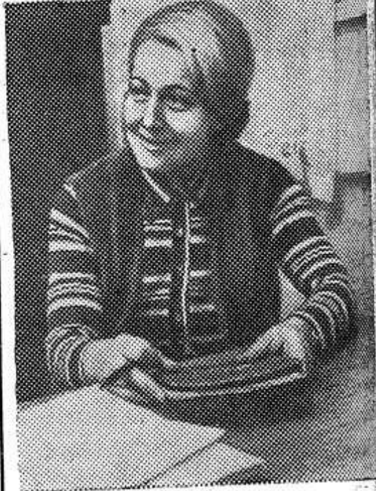
ЧССР. Около 47 процентов всех трудящихся в республике составляют женщины.

Занимая важное место в производстве страны, чехословацкие женщины крепко, хозяйски взяли «бразды правления» во всех общественных и государственных сферах управления. Так, 25 процентов всех депутатских мандатов принадлежит женщинам, 40 процентов всех работников профсоюзов также составляют женщины.