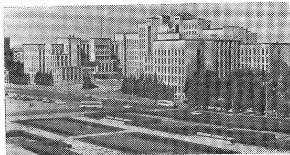
Минск. Площадь В. И. Ленина.