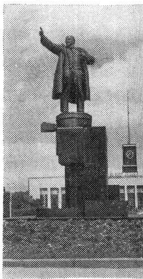
Ленинград. Памятник В. И. Ленину у Финляндского вокзала.