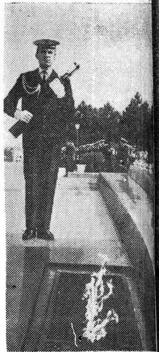
Севастополь. У Вечного огня на Сапун-горе, зажженного в честь освободителей города.

К 30-летию победы над фашистской Германией