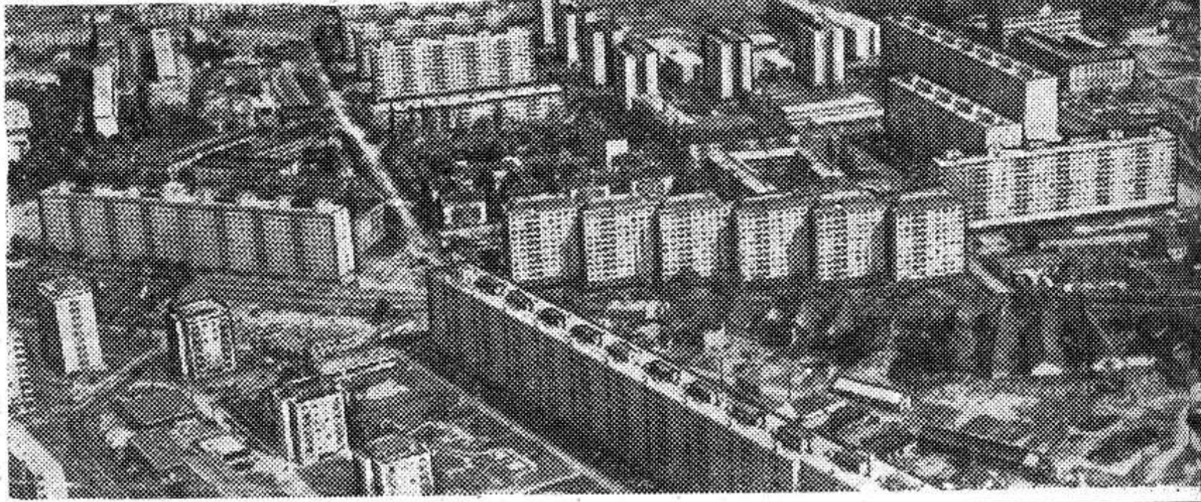
Комплексная программа СЭВ в действии