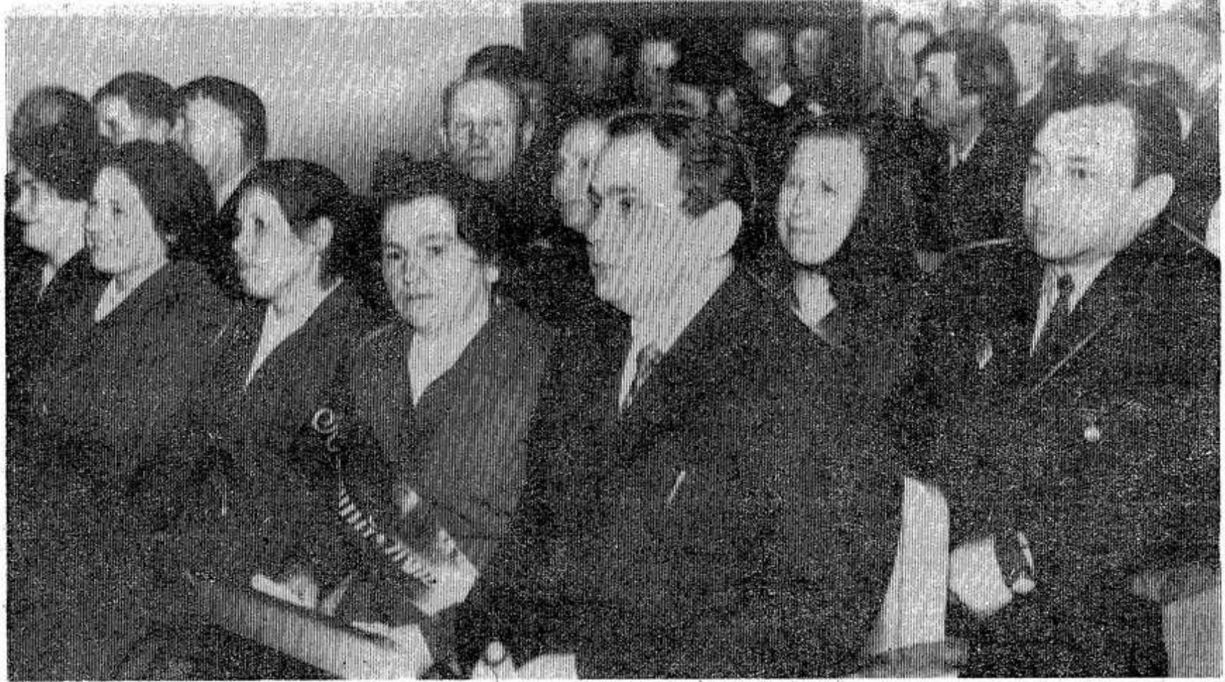
НА СНИМКАХ: участники слета в зале заседания.