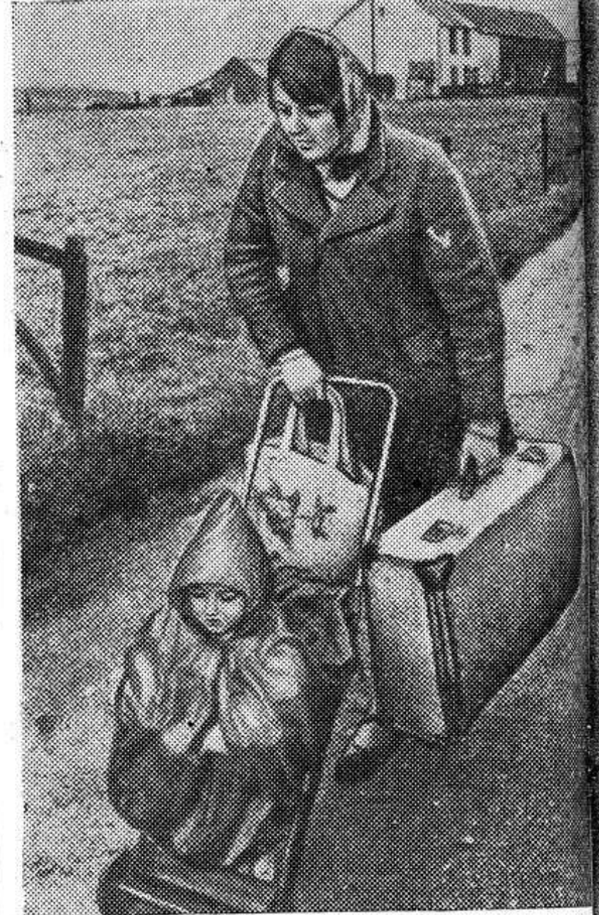
Англия. Каждое утро эта измученная женщина с ребенком отправляется в путь. У нее нет дома и она носит с собой все свое небольшое имущество. А вечером ее и малыша, как многих тысяч англичан, ждет приют для бедняков.

ПРАВИТЕЛЬСТВО ГВИНЕИ-БИСАУ приняло решение о переименовании улиц и площадей столицы республики. Отныне главная улица Бисау будет носить имя Амилькара Кабрала — основателя Африканской партии независимости Гвинеи и островов Зеленого Мыса (ПАИГК).