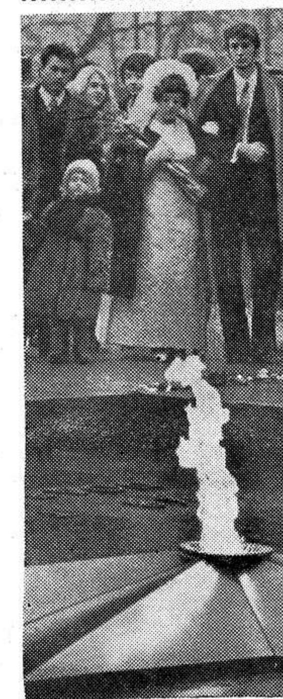
Москва. У могилы Неизвестного солдата.

Совет командиров военно-патриотического батальона г. Калинин. «Подвиг».