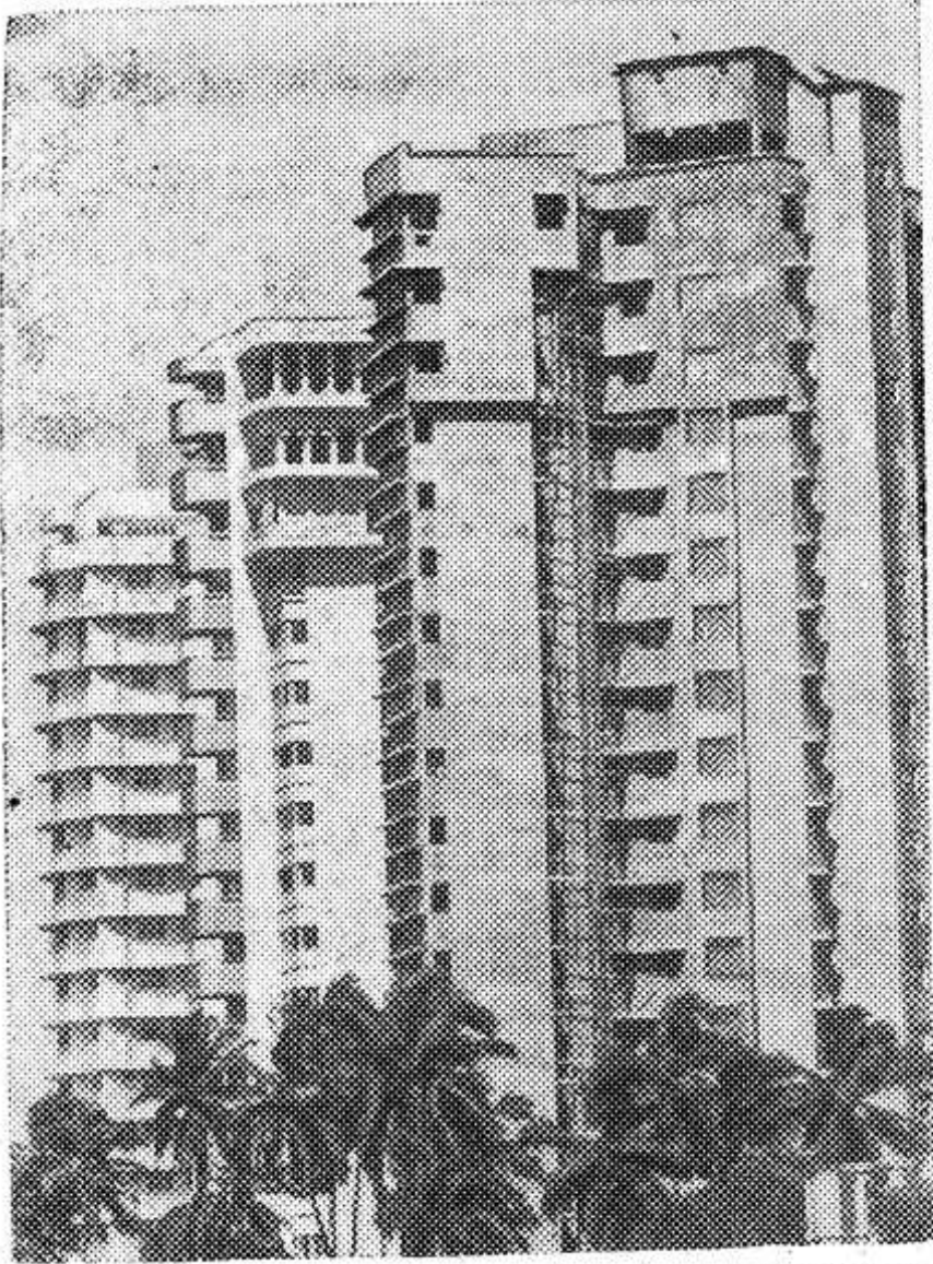
26 января — национальный праздник индийского народа. В этот день в 1950 году после трех лет независимости Индия была провозглашена республикой. НА СНИМКЕ: новостройки в пригороде Бомбея.