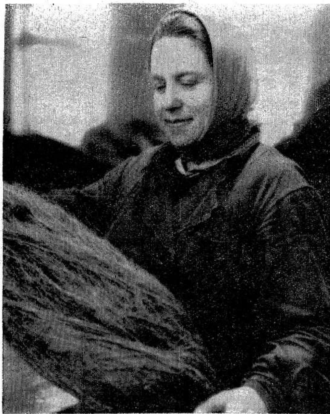
трет занесен в Книгу почета предприятия.

Затем конференция продолжила свою работу. Были прочитаны доклады о военно-патриотическом воспитании, о дальнейшем совершенствовании работы по пропаганде знаний о гражданской обороне. Участники конференции обменялись опытом работы.