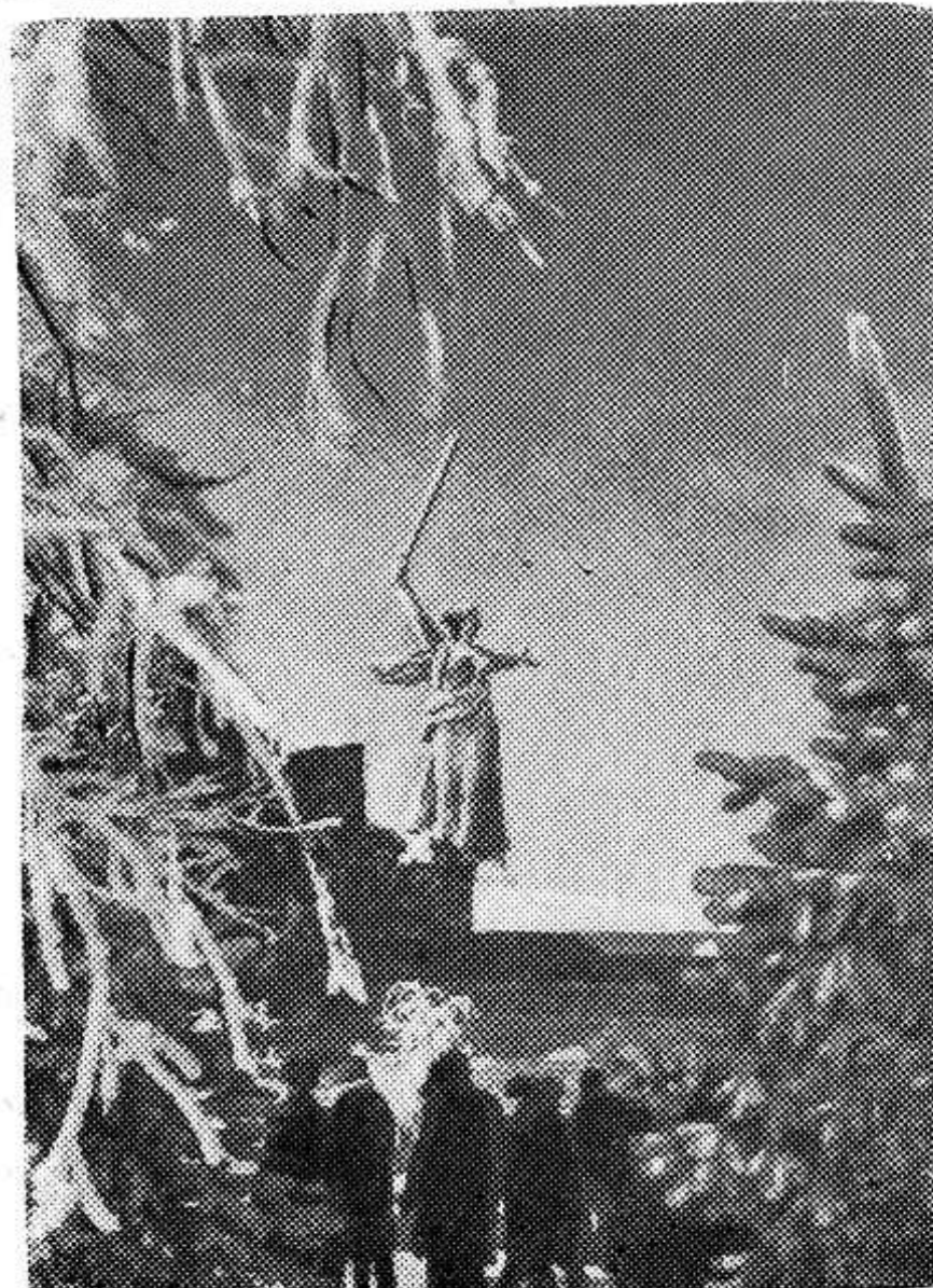
Волгоград — город-герой. Здесь велись самые ожесточенные бои наших войск с немецко-фашистскими захватчиками.