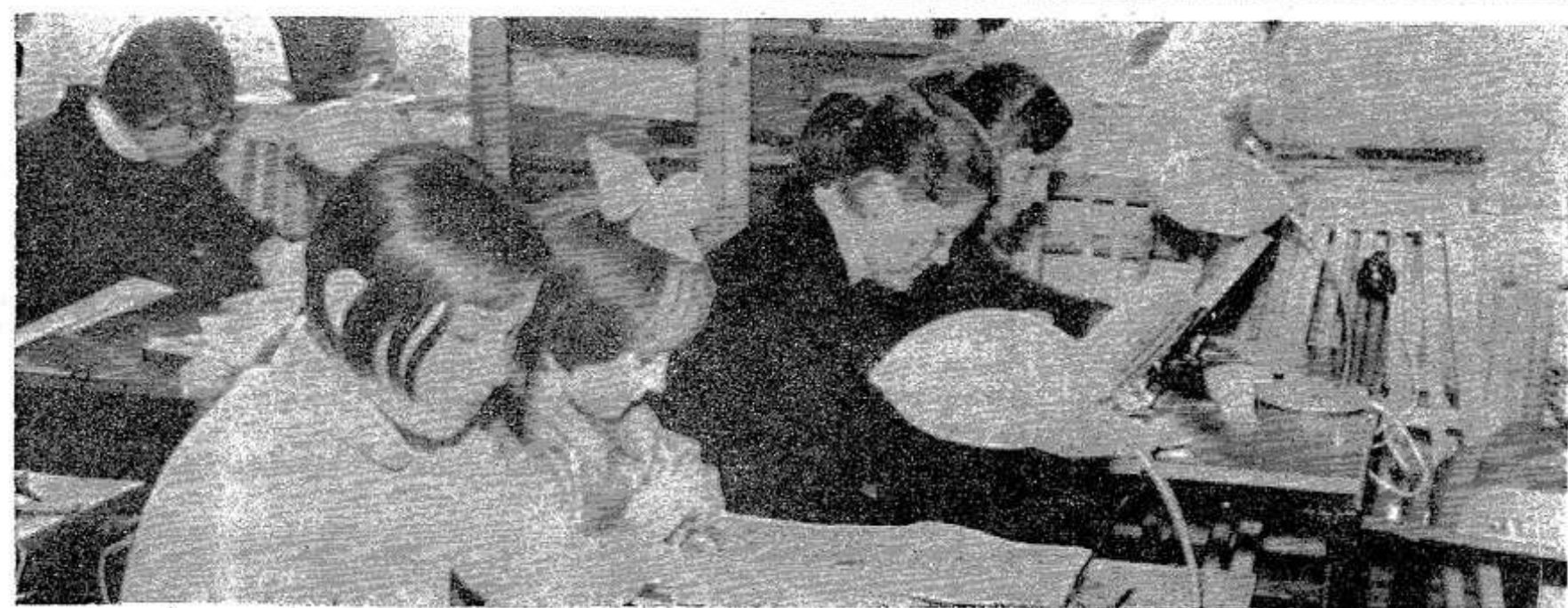
НА СНИМКЕ: в детской районной библиотеке в дни школьных каникул.