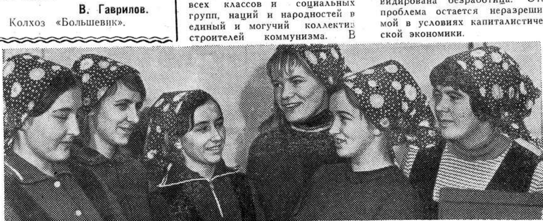
В Конституции СССР записано: «Граждане СССР имеют право на труд, то есть право на получение гарантированной работы с оплатой их труда в соответствии с его количеством и качеством».

В исторически короткий срок, к концу 1930 года, в нашей стране впервые в мировой истории была полностью ликвидирована безработица. Эта проблема остается неразрешимой в условиях капиталистической экономики.