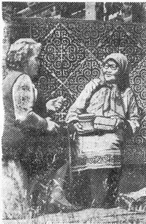
ХАБАРОВСКИЙ КРАЙ. Сегодняшний день нанайского села — новые каменные дома, школы, промышленные предприятия, новые современные профессии. Среднее фото Ю. Муравина.

За восемь километров до зоны густого тумана зажигается желтая лампочка, за три — начинает мигать красная, а за два километра включается звуковой сигнал.