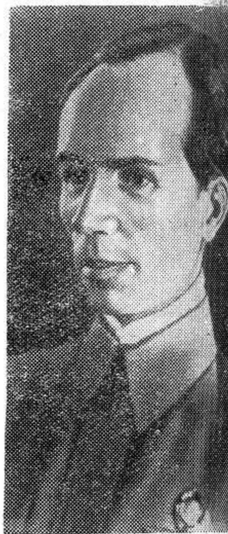
Сколько всегда будет ярким маяком для нашей молодежи, — писал Юрий Гагарин.

29 сентября исполняется 70 лет со дня рождения Николая Алексеевича Островского. Жил Николай Островский недолго — всего тридцать два года, из них четырнадцать лет тяжело болел, последние семь лет он был слепым. Борьбой и испытаниями наполнена вся его жизнь. В 1919 году пятнадцатилетний Островский добровольцем ушел на фронт, он сражался в бригаде легендарного Котовского, несколько раз был ранен. На фронтах гражданской войны будущий писатель был «из тех ораторов, которые зажигают сердца бойцов». В 20-е годы Островский — активный вождь комсомола на Украине. Будучи прикованным к постели, Н. Островский написал замечательную книгу о героической судьбе своих сверстников — участников гражданской войны. «Как закалялась сталь» — одно из лучших произведений социалистического реализма. В образах героев своих книг «Как закалялась сталь» и «Рожденные 9-м мая» писатель воплотил высокие нравственные черты коммунистов. «Жизнь Николая Остров-