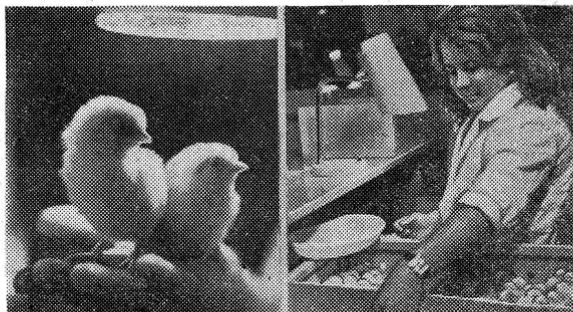
Москва. На Выставке достижений народного хозяйства СССР в павильоне «Животноводство» проходил 3-й Всесоюзный конкурс сортировщиков цыплят. В нем участвовали 134 человека из 11 республик страны.

Сортировка цыплят на курочек и петушков дает возможность организовать их правильное выращивание с первого дня жизни. При этом методе привес повышается на 8—10 процентов, более эффективно используется производственная площадь. Сортировка применяется и при выращивании бройлеров утят и индюшат.