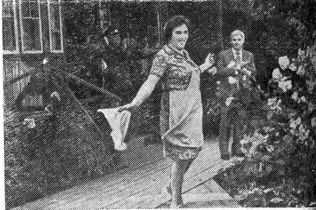
...ная артистка СССР Нонна Мордюкова. НА СНИМКЕ: Нонна Мордюкова и Николай Рыбников во время съемки одного из эпизодов фильма.

География съемок обширна. Мосфильмовцы будут работать в Подмоскovie, Волгограде, в Болгарии. Главную роль — сталевара Иванова играет заслуженный артист РСФСР Николай Рыбников, в роли его жены — народ-