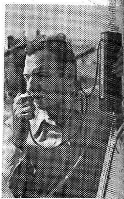
Хороший результат для степного Оренбуржья.

Хорошо идут дела в совхозе и в четвертом году пятилетки. 21 центнер зерна с гектара получают нынче механизаторы. Это хо-