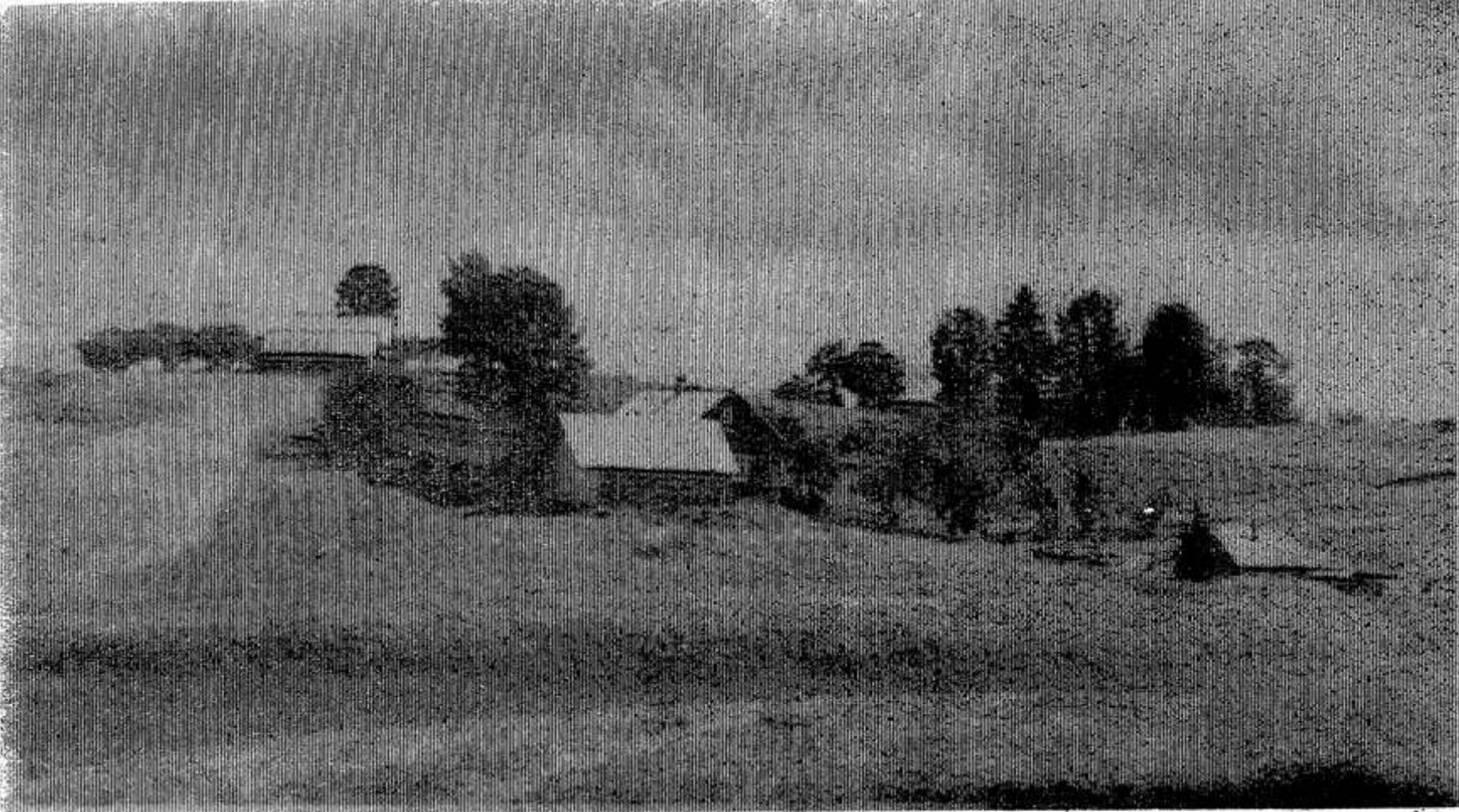
Страда сенокосная — тишина в деревне.

И видя друга еле-еле, Орет Косой, прижавшись к ели: — Вот выпьем мы с тобой сейчас В честь дружбы, в честь веселья, Возьмем бутылочку в запас, Как говорится, для похмелья. Ну, а затем и по домам — Снесем гостинцы малышам... Но не дошли друзья домой По переулку лесному. И обрели они покой В медвытрезвителе — не дома. Вот так порою и в роду людском: С получки — пьянка, а беда — потом.