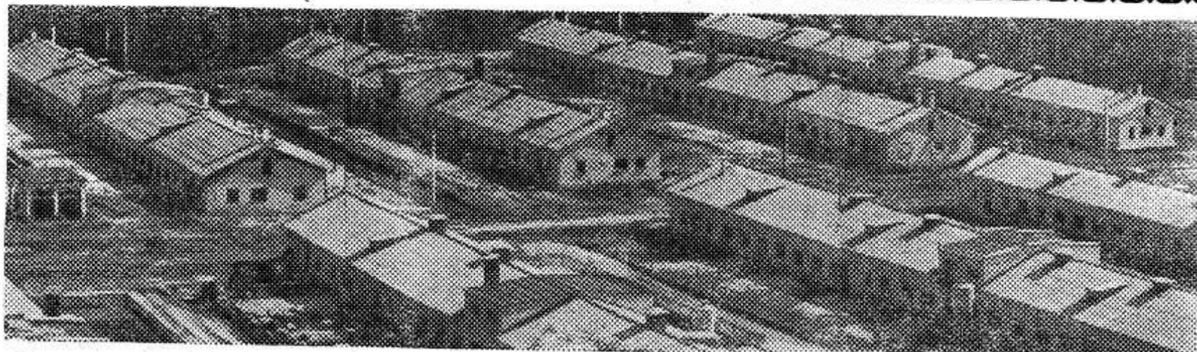
Калининская область. Государственная комиссия приняла у строителей с оценкой «хорошо» репродукторную ферму (на снимке) совхоза имени 50-летия СССР. Этот сельскохозяйственный объект введен в строй на полгода раньше срока.