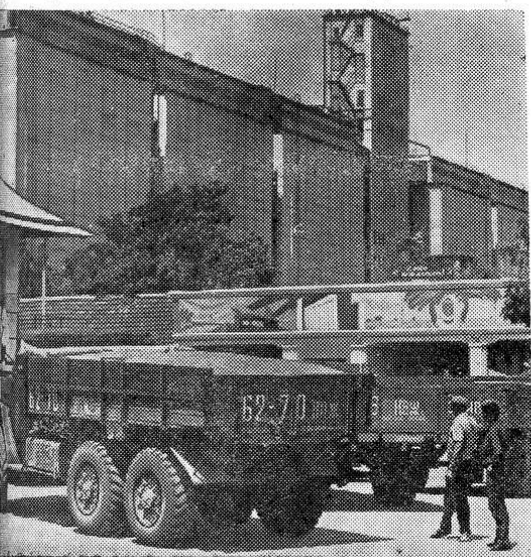
Славяпольский край. Несконный поток автомашин с зерном уносит урожай. Из хозяйств Кировского и Туркменского районов идут караваны на Светлоярский хлебоприемный пункт (на снимке). Ежедневно элеватор перерабатывает более десяти тысяч тонн зерна.