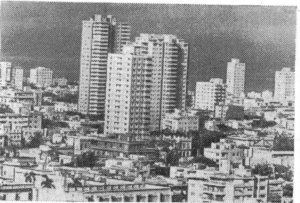
НА СНИМКЕ: столица острова Свободы — Гавана.

НЕТ в Ленинграде здания старше, чем это — деревянное, одноэтажное, скрытое под каменным футляром. Это самая первая постройка города, ныне музей — домик Петра I.