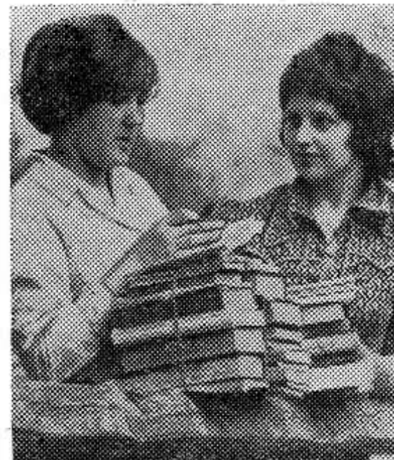
Звановская сельская библиотека Глушковского района — лучшая в Курской области. В селе Званое каждый второй житель — ее читатель.

дым годом земли все более и более истощаются и не дают должного эффекта. Осушенные земли под сенокос и культурные пастбища должны использоваться под полевые культуры не более 2—3 лет. В настоящее время все хозяйства, где должно вестись залужение, испытывают недостаток семян многолетних лугопастбищных трав. Поэтому необходимо заложить семенники трав, чтобы иметь свои семена. В результате неправильного использования мелиорированных земель и отсутствие надлежащего учета продукции урожайность за последние три года идет на убыль. Например, в колхозе «XXI партсъезд» урожай зерновых в 1969 году составил 21,8 центнера с гектара, а в 1973 — 10,9, картофеля в 1970 году получено 130 центнеров с гектара, а в 1972 — 84,6. В колхозе «Авангард» в 1969 году собрали с одного гектара зерновых по 16,8 центнера, в 1970 — 14,8, в 1972 — 7,9. В колхозе имени Любимова в 1970 году получено зерновых по 15,6 центнера с гектара, а в 1973 — 9. Эти цифры говорят о том, что если к мелиорируемым землям относиться без хозяйского внимания, то пользы никакой не будет. Поэтому сейчас перед руководителями всех хозяйств стоит главная задача — стать лицом к осушенным землям. Р. Браварник, инженер по технадзору управления сельского хозяйства.