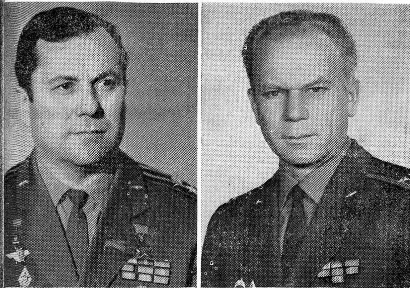
НА СНИМКАХ: командир экипажа космического корабля «Союз-14» ПАВЕЛ РОМАНОВИЧ ПОПОВИЧ — летчик-космонавт СССР, полковник, Герой Советского Союза. Бортинженер космического корабля «Союз-14» ЮРИЙ ПЕТРОВИЧ АРТЮХИН, подполковник.