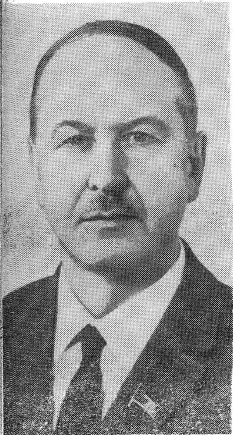
Б. Н. Пономарев