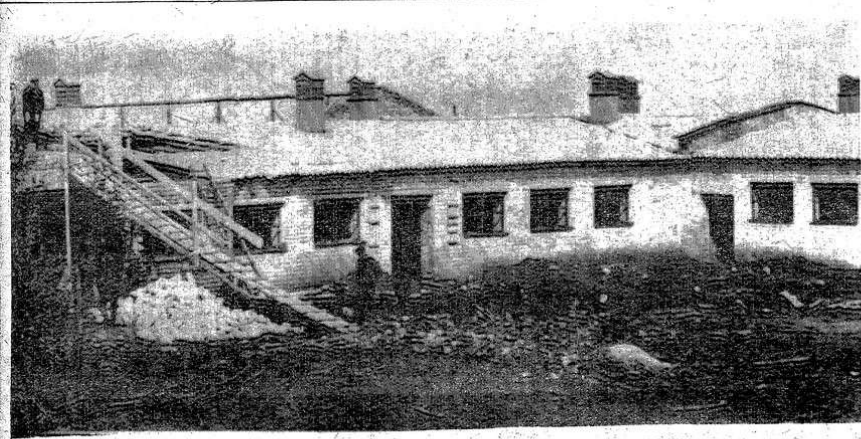
Мяраду с жилищным, административным и культурно-бытовым строительством в колхозе «ХХI партсъезд» возводятся животноводческие помещения. Самым крупным из них будет животноводческий комплекс на 400 голов дойного стада в деревне Аристово. (На снимке).

БОЛЬШОЙ радостью восприняли животноводы нашего хозяйства постановление ЦК КПСС и Совета Министров СССР о мерах по дальнейшему развитию сельского хозяйства Нечерноземной зоны РСФСР. Ведь каждый из нас прекрасно знает, сколько трудностей в производстве животноводческой продукции приходится порой испытывать. Одной и самой главной из них является недостаток кормов. Теперь, когда широким фронтом ведутся мелиоративные работы, когда каждый гектар пашни получит полную дозу удобрений, будут созданы необходимые условия для укрепления кормовой ба-