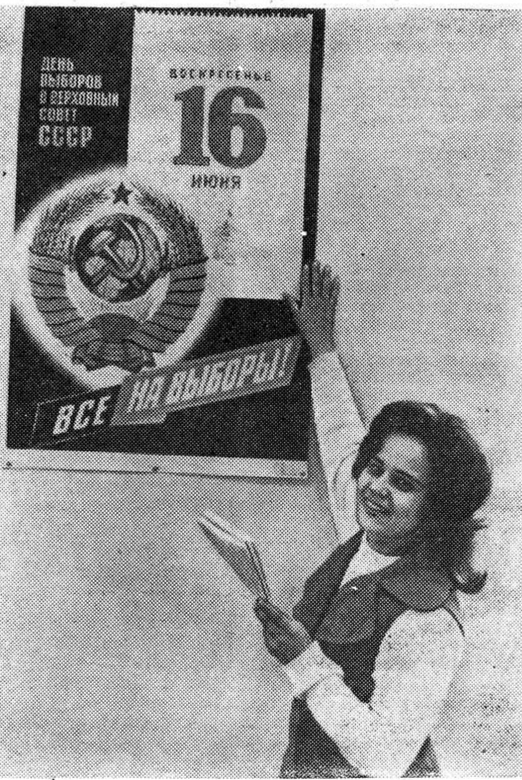
ВСЕ НА ВЫБОРЫ!

За досрочное выполнение полугодового плана коллективы льнозавода и литейного участка ремзавода решением бюро РК КПСС и исполкома райсовета занесены на щит районного вестника. В честь этих коллективов зажжена звезда трудовой славы.