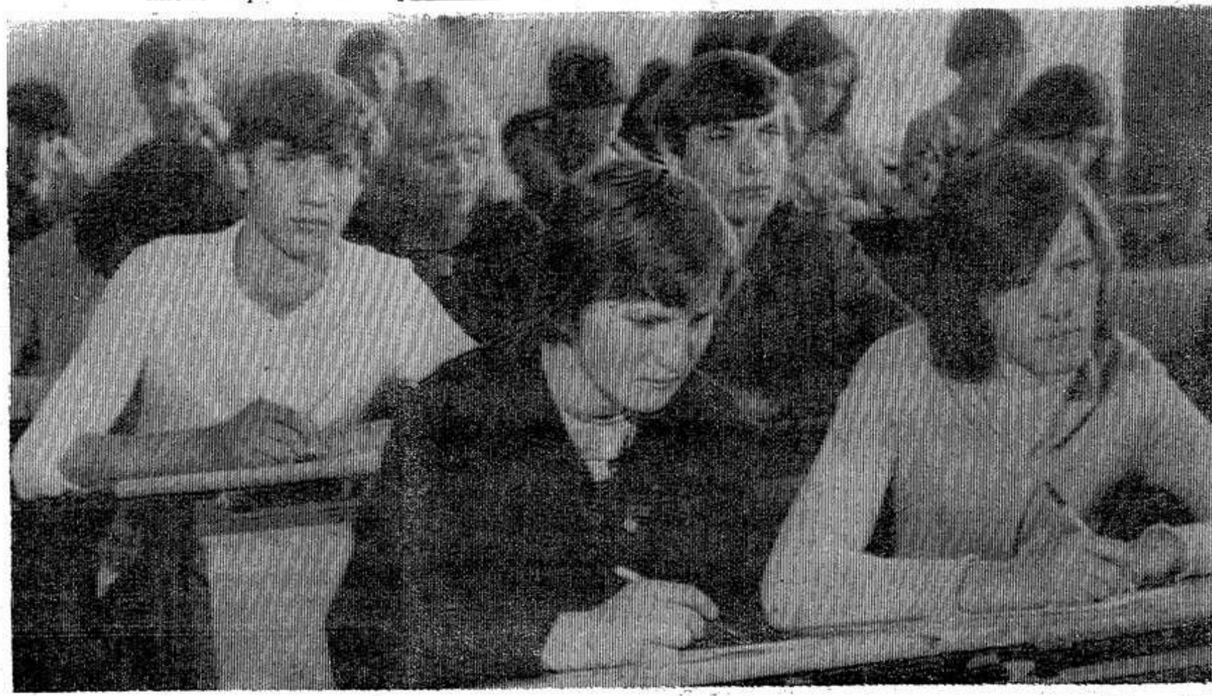
НА СНИМКЕ: письменную работу выполняют учащиеся школы-интерната. Первый экзамен выдержали все 62 выпускника.