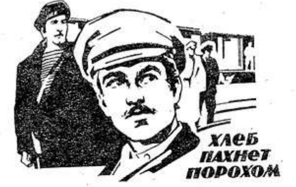
ХЛЕБ ПАХНЕТ ПОРОХОМ