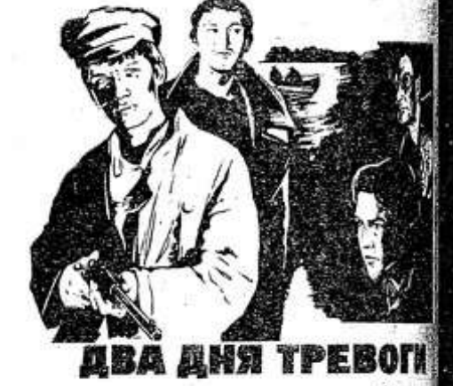
ДВА ДНЯ ТРЕВОГИ