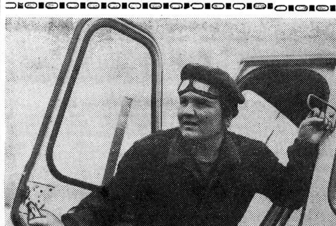
Молдавская ССР. Пятьсот гектаров пашни закреплены в колхозе имени Котовского Сорокского района за механизированным звеном, которое возглавляет Герой Социалистичес-