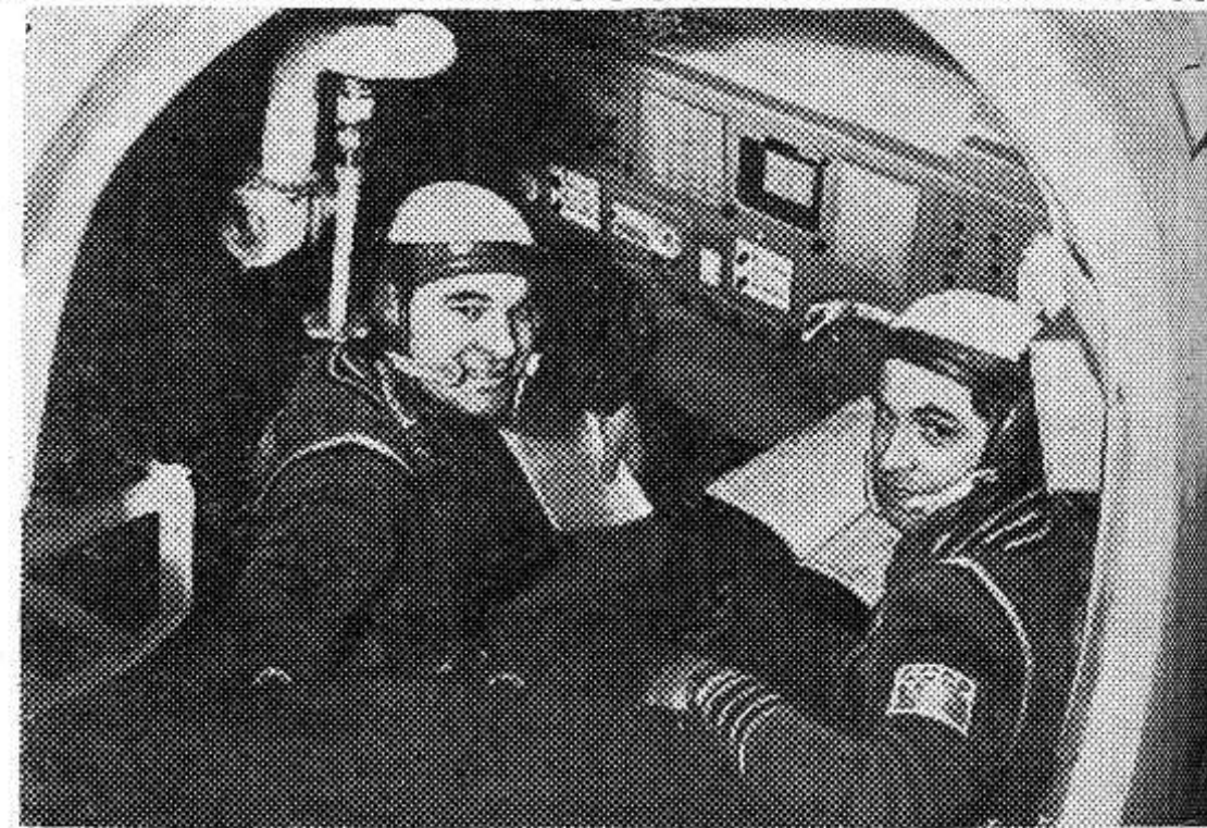
В Центре подготовки космонавтов имени Ю. А. Гагарина на новом тренажере космического корабля «Союз» проходят тренировки экипажи, готовящиеся к полетам по совместной