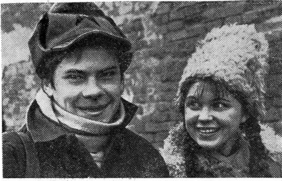
Близ Житомира идут съемки фильма «Километры мужества». Это второй фильм киноэпопеи «Дума про Ковпака» производства творческого коллектива киностудии имени Довженко, Републики Беларусь.

жиссер-постановщик трилогии народный артист СССР, лауреат Государственной премии УССР имени Т. Г. Шевченко Т. В. Левчук.