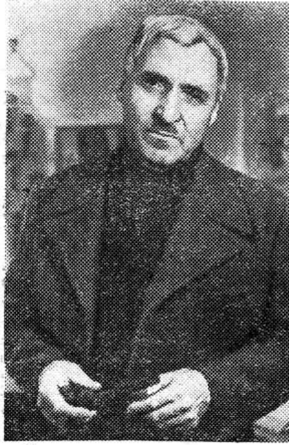
Последнее произведение писателя, его трилогия о Великой Отечественной войне, выходящее литературное явление нашего времени, в которой слились воедино и роман-событие и роман-судьба. Эта прекрасная эпопея — памятник героизму советского народа в жесточайшей из войн.

Писатель Константин Михайлович Симонов выдвинут на соискание Ленинской премии 1974 года за трилогию «Живые и мертвые» («Живые и мертвые», «Солдатами не рождаются», «Последнее лето».) К. М. Симонова хорошо знает вся читающая публика нашей страны.