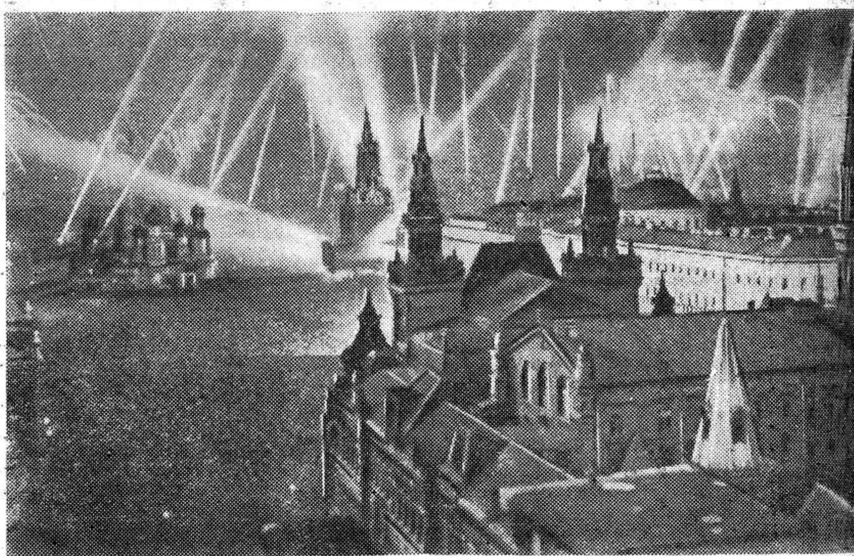
День Победы 9 мая 1945 года. 22 часа. В ознаменование полной победы над Германией столица нашей Родины Москва салютует доблестным войскам Красной Армии, кораблям и частям Военно-Морского Флота.