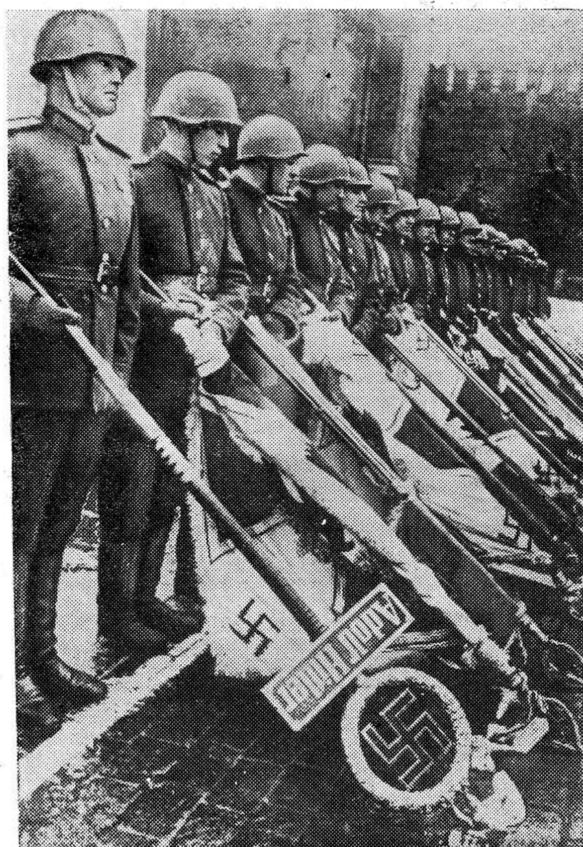
Москва. Парад Победы. Эти гитлеровские знамена будут брошены к подножию Мавзолея.