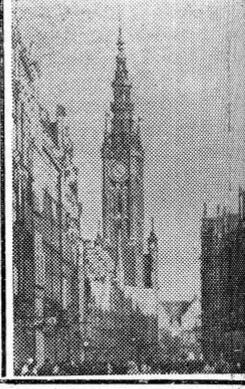
НА ВЕРХНЕМ СНИМКЕ: Гданьская улица в Ленинграде. НА НИЖНЕМ СНИМКЕ: Башню Гданьской ратуши.