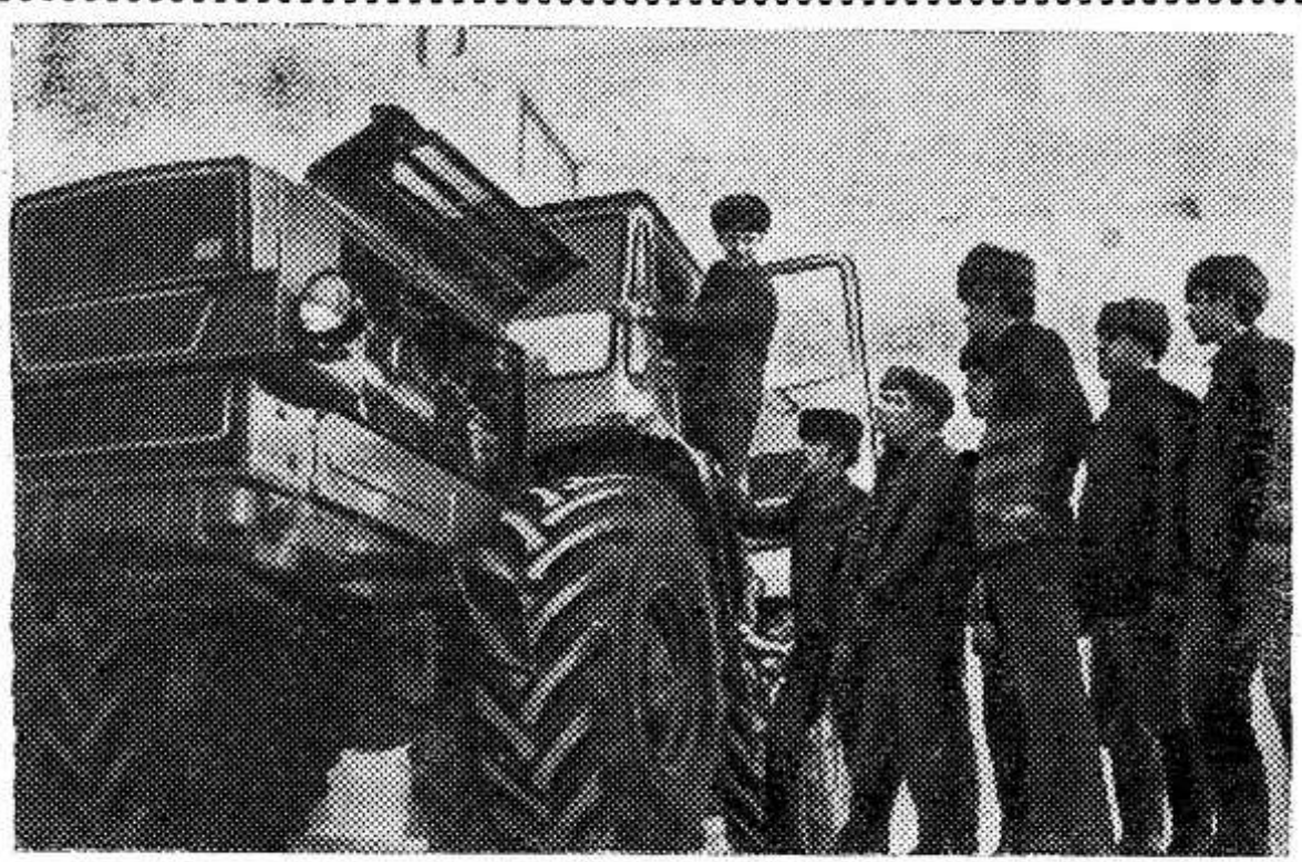
Ленинградская область. Для Лужского сельскохозяйственного ПТУ-7 нынешний учебный год — первый. Триста юношей и девушек получают здесь специальности тракториста-машиниста широкого профиля. Почти все учащие-

ся 25 рублями. Устанавливается денежная премия и для бригады, занявшей второе место. В горячую пору весенних полевых работ сельские труженики не всегда смогут своевременно почитать газету, послушать радио, посмотреть телевизионную передачу. Поэтому за полеводческими бригадами, механизированными звеньями закрепляются агитаторы и политинформаторы. Рабочий план обсужден и одобрен на партийном собрании, заседании рабочего комитета, совещании механизаторов.