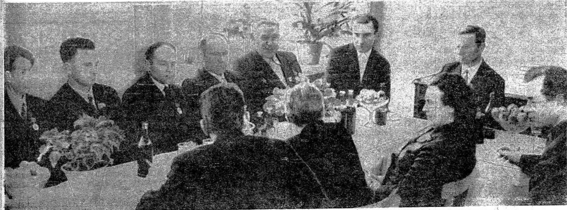
НА СНИМКЕ: участники «круглого стола» за беседой.

Мы призываем вас, товарищи механизаторы, поддержать инициативу механизаторов Казахской ССР, Белорусской ССР и Ростовской области, а также Локнянского района Псковской области привести в действие все резервы, использовать весь свой опыт и мастерство для повышения производительности сельскохозяйственной техники, для достижения новых рубежей в осуществлении решений XXIV съезда КПСС.