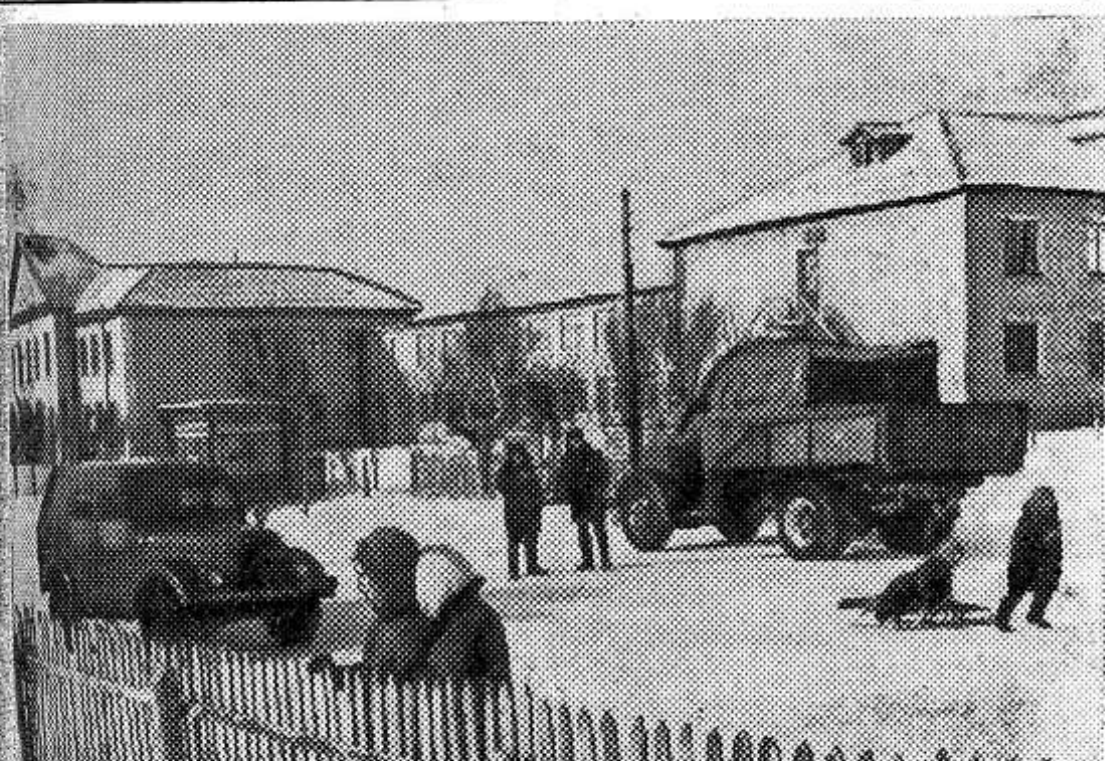
Челябинская область. В неосвоенную степь Южного Урала, по призыву партии, в 1954 году прибыли первые новоселы, чтобы освоить богатые земли.