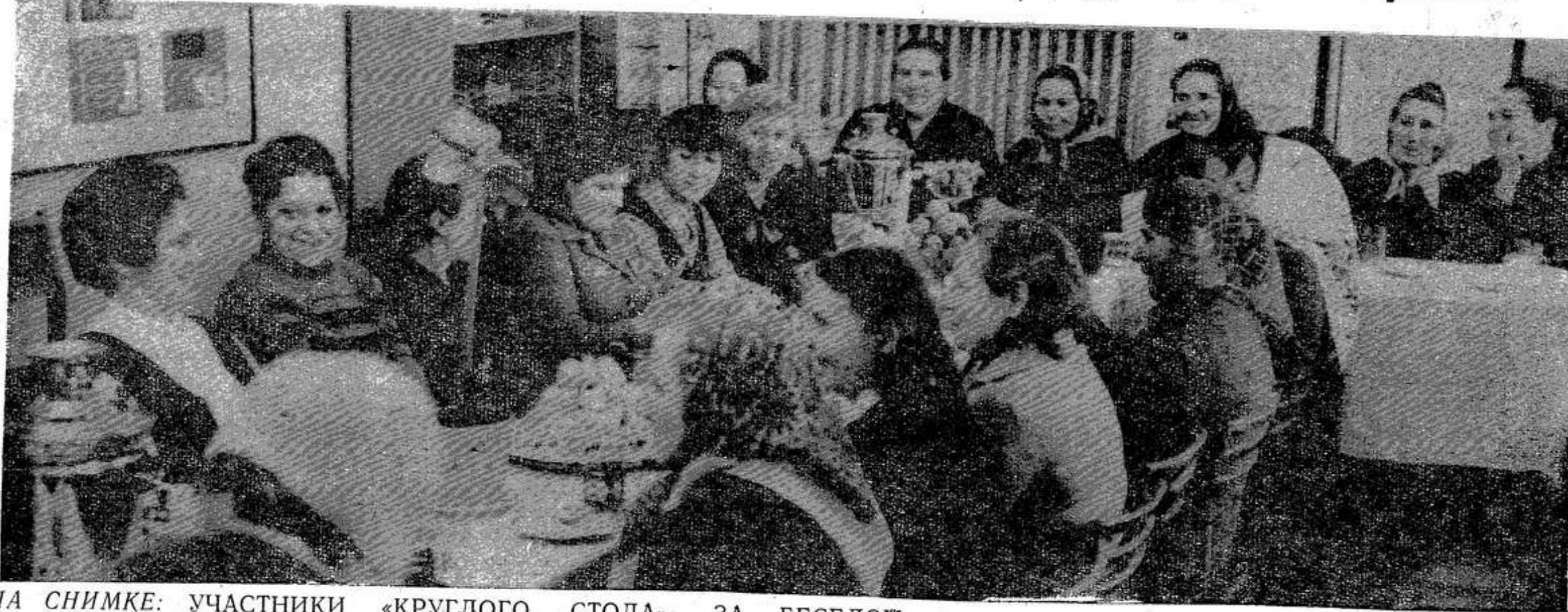
НА СНИМКЕ: УЧАСТНИКИ «КРУГЛОГО СТОЛА» ЗА БЕСЕДОЙ.

В заключение беседы участники «круглого стола» приняли обращение ко всем дояркам района.